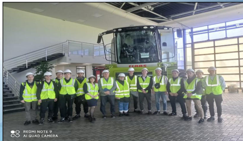
Организация дуального обучения