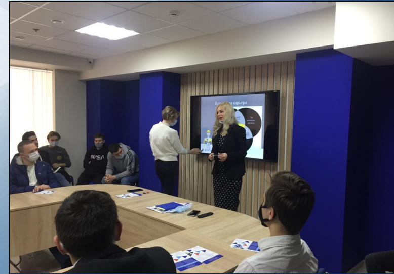
Тренинги с кадровым центром