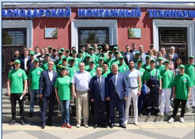
Проведение краевых и федеральных конкурсов профмастерства