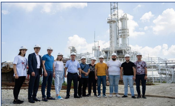
Экскурсии на предприятия