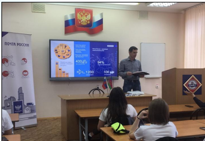
Проведение мастер-классов с ведущими работодателями